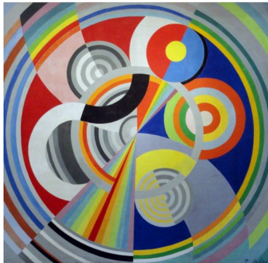
Robert Delaunay, Rythme n°1